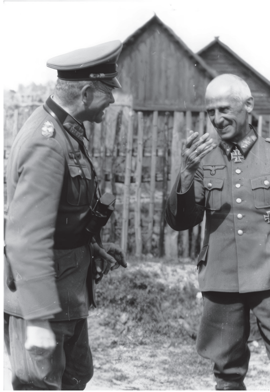
GUDERIAN CHARLA CON EL GENERAL OBERST HERMANN HOTH EN ALGÚN LUGAR DEL FRENTE ORIENTAL, EN JUNIO DE 1941.

lastradas por el hecho de que el 5.º Ejército soviético resistía en la zona del Pripet, al noroeste del grupo de ejércitos alemán, y lanzaba poderosos ataques en su retaguardia; estaba claro que hasta que no se resolviese tan molesta cuestión —que a mediados de julio ya no se podía ignorar por más tiempo— el avance no podía proseguir. Tratándose de una cuestión estratégica, Rundstedt consultó a Hitler el 17 de julio, y en consecuencia este emitió el 19 de julio la Directriz 33 del OKW, significativamente titulada: «Continuación de la guerra en el Este». En ella se hacía una consideración general de la situación, de acuerdo a la cual Hitler desviaba la atención hacia los grupos de ejércitos norte y sur, en detrimento del central, en ese momento ocupado en la liquidación de las unidades soviéticas cercadas, pero aún no derrotadas en la batalla de Smolensko. Allí, enormes contingentes soviéticos resistían entre las pinzas de las divisiones panzer , que no se bastaban