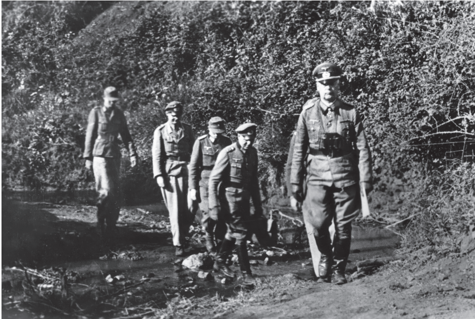
EBERHARD VON MACKENSEN EN ANZIO EN 1944.

incluía con un carácter perentorio la necesidad de incrementar la actividad de la Luftwaffe contra la retaguardia de las fuerzas soviéticas situadas frente al Grupo de Ejércitos Sur. Y si bien una semana más tarde, el jueves, 3 de julio, Halder manifestaba su seguridad de que, en lo esencial, la campaña ya se había ganado «en dos semanas» 1 , al día siguiente Hitler reconocía que la «decisión más difícil de la guerra» era si debilitar el frente central para enviar sus fuerzas acorazadas hacia el norte y capturar la antigua capital zarista o dirigirse hacia Ucrania. En el Grupo de Ejércitos Centro, solo las fuerzas de infantería se mantendrían en sus posiciones, pasando a la defensiva. Moscú quedaba, así, en un segundo plano. Ambos estaban convencidos de que la guerra había concluido en su fase esencial, pero Hitler parecía más receloso que su jefe de Estado Mayor en cuanto a dar por muerto al enemigo. 2