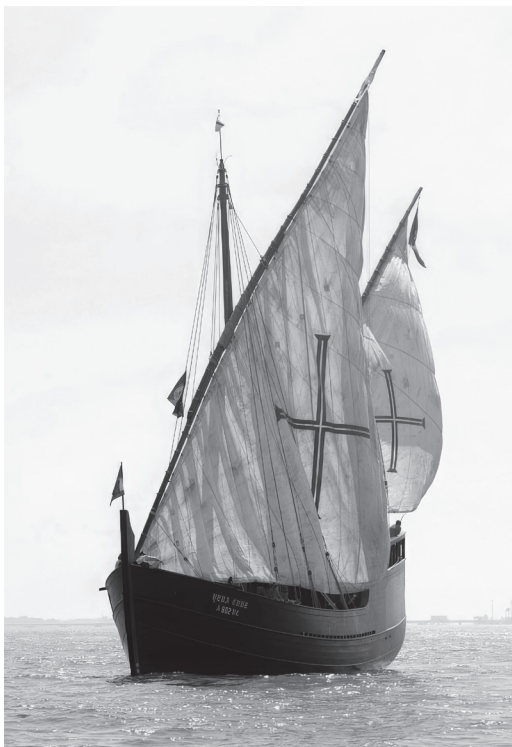
Carabela portuguesa Vera Cruz, por Lopo Pizarro, CC 4.0; muy parecidas serían las naves de Bartolomeu Dias, aunque es posible que arbolasen velas cuadradas.

cediendo el control de las islas a Portugal para concentrar sus expediciones y buques en el océano Atlántico y las posesiones americanas.