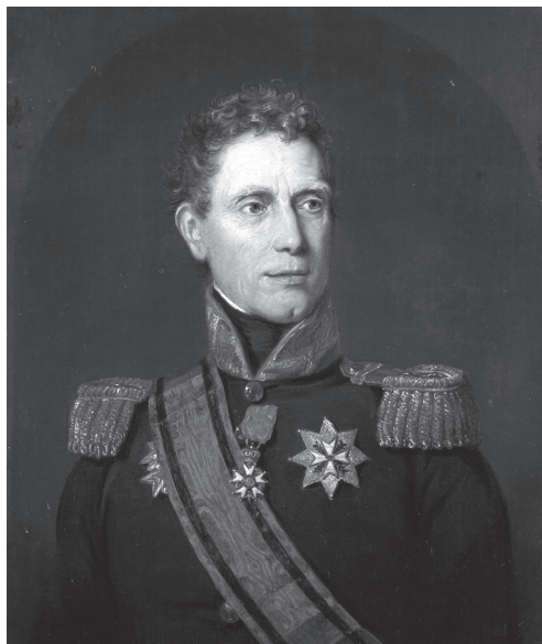
Teniente general Jan Willem Janssens, óleo de J. W. Pieneman, Rijksmuseum , Amsterdam.

Ciudad del Cabo regresó a la soberanía de la República de Batavia en 1803 a consecuencia de los acuerdos adoptados en las negociaciones de la Paz de Amiens; sin embargo, la reanudación de las hostilidades ante los incumplimientos de las condiciones aceptadas por Francia y Gran Bretaña 13 , junto con el regreso al cargo de primer ministro británico del combativo William Pitt, llevaron a la preparación de una nueva expedición anfibia contra el territorio sudafricano de soberanía neerlandesa.